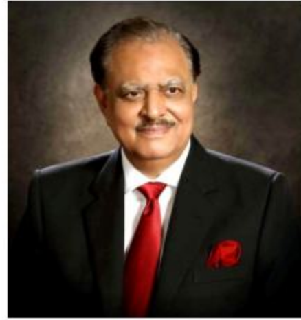
معالي السيد ممنون حسين رئيس جمهورية باكستان الإسلامية ، الرئيس الأعلى للجامعة