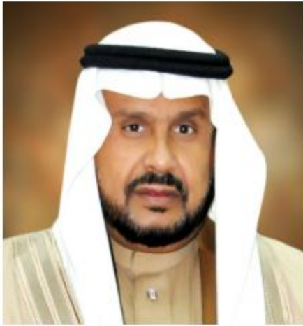
معالي الأستاذ الدكتور أحمد يوسف أحمد الدريويش رئيس الجامعة