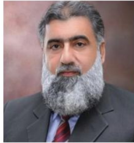
معالي الأستاذ الدكتور معصوم ياسين زني راعي الجامعة