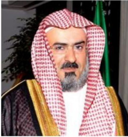
معالي الأستاذ الدكتور سلمان بن عبد الله أبو الحجيل نائب رئيس الأعلى للجامعة